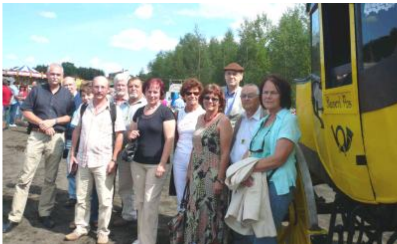
Besuch in unserer Partnergemeinde Pfaffroda im Erzgebirge vom 21. bis 24. August 2009 anlässlich der dortigen 800-Jahr-Feier

Im Zusammenhang mit den Feierlichkeiten zum 20-jährigen Fall der Mauer wurde im Museum Rheinheim eine Ausstellung konzipiert, welche die verschiedenen Aspekte der Volkspolizei in der DDR bekannt machte. Mit zahlreichen Ausstellungsstücken wurde die Zeit der Trennung zwischen der BRD und der DDR noch einmal deutlich.