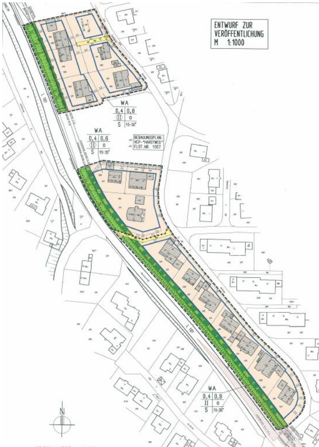
Geltungsbereich des Bebauungsplanes „Hardtweg-Landstraße“