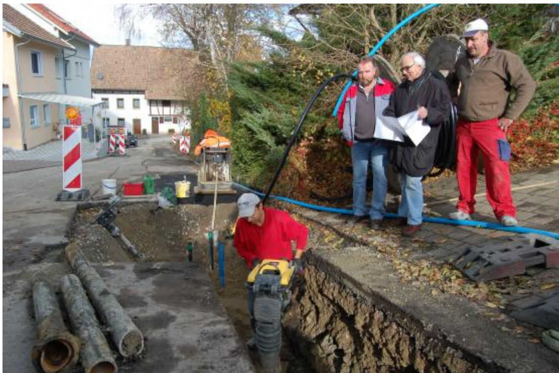
Im Allmendweg in Bechtersbohl wird eine neue Wasserleitung verlegt