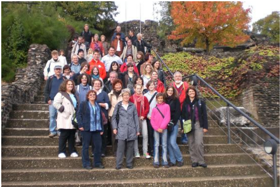
Am 9. Oktober 2009 besuchte eine Delegation aus Küssaberg La Talaudière