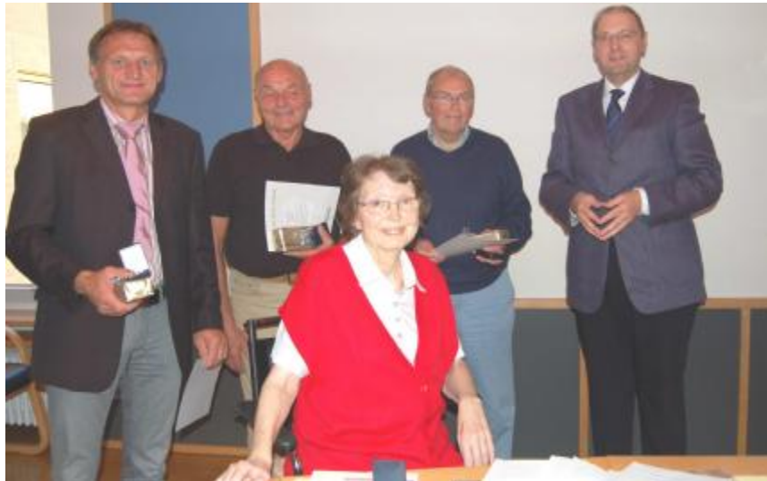
Ehrung für 20-jährige Tätigkeit im Gemeinderat Küssaberg

für ihre 20-jährige Tätigkeit im Gremium geehrt. Der Gemeindetag Baden-Württemberg hat auf Antrag der Gemeinde den vorgenannten ehrenamtlich tätigen Kommunalpolitikern die Ehrennadel in Silber vergeben.