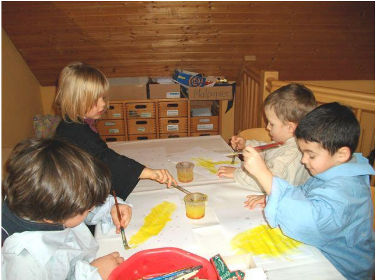
Die Fachkräfte der Küssaburger Tageseinrichtungen leisten eine engagierte Arbeit, die auch von Aufsichtsstellen rundum anerkannt wird