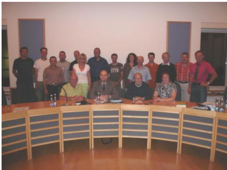
Der neu gewählte Gemeinderat