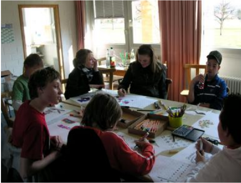
Graffitiworkshop im Rahmen des SE (sozialen Engagements) am 21. März 2009