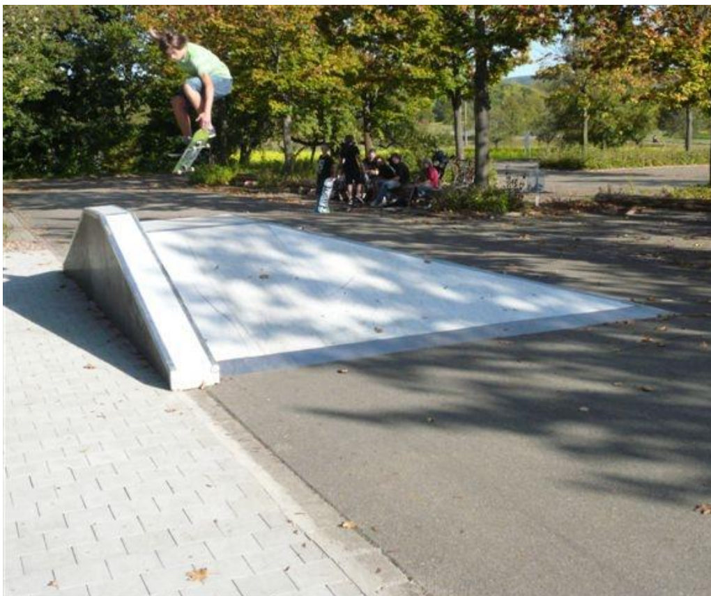
Die „Pyramide“ als Teil der neuen Skater-Anlage auf dem Parkplatz des Gemeindezentrums Küssaberg

Weiterhin Hauptschwerpunkt der offenen Arbeit bildete die Altersgruppe ab 12 Jahre. Seit Herbst 2008 wurde intensiv an einer Lösung zum fehlenden Skateplatz gearbeitet. In einem gemeinsamen Gespräch mit den ca. 20 Jugendlichen der „Crazy Rollers“, der Gemeindeverwaltung und dem Gemeinderat war übereinstimmend der Standort am Gemeindezentrum festgelegt worden. Weiterhin wurden im Vorfeld alle notwendigen Informationen eingeholt und die Kosten mit dem Gemeinderat debattiert. In den Sommerferien wurden gemeinsam mit dem Bauhof die Vorarbeiten zur Installation der Skate-Anlage durchgeführt. Anfang Oktober war es dann soweit, dass die Anlage benutzt werden konnte.