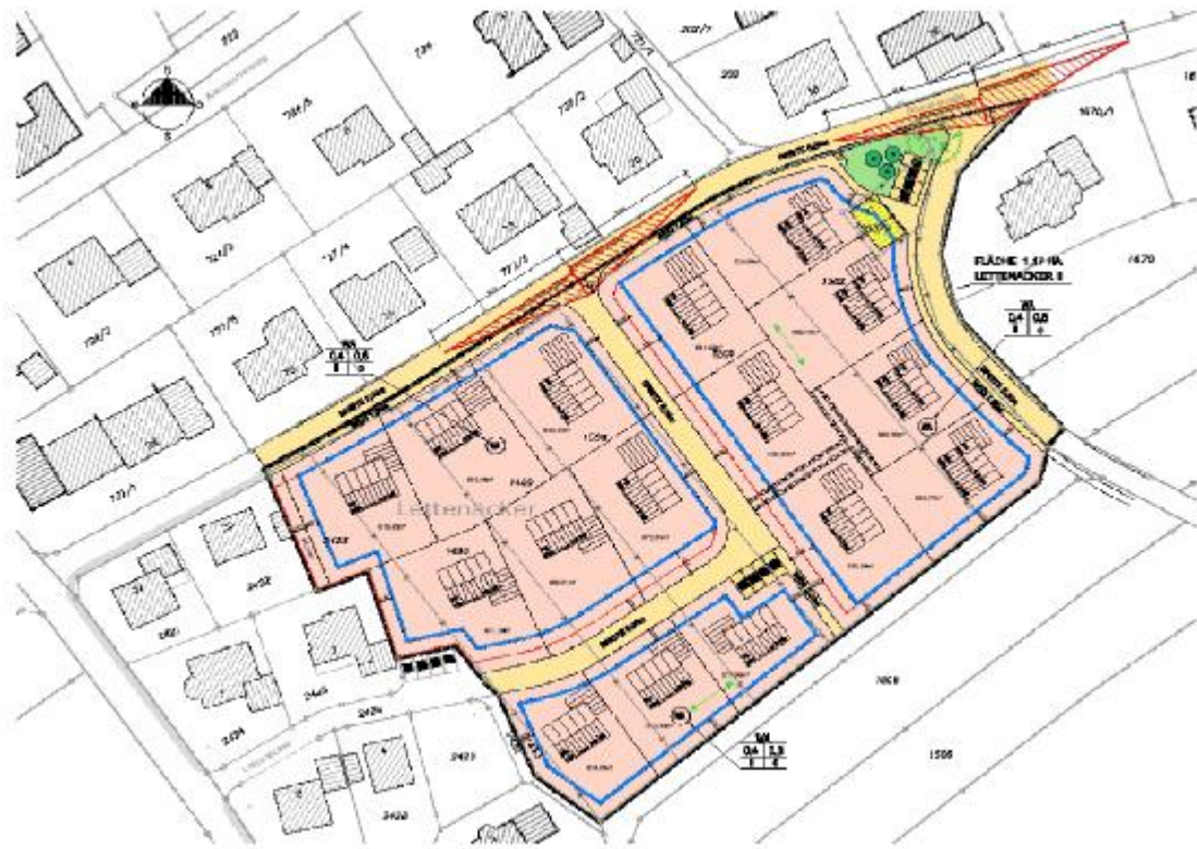
Geltungsbereich des Bebauungsplanes „Lettenäcker II“ (im Entwurf)

Am 27.07.2009 fasste der Gemeinderat den Aufstellungsbeschluss zur Einleitung des notwendigen Bebauungsplanverfahrens. Zwischenzeitlich konnte die Planung in einer weiteren Sitzung noch einmal konkretisiert werden. Bewährterweise wird die Erschließungsplanung in den Grundzügen parallel mit dem Bebauungsplan erstellt; damit werden Synergieeffekte genutzt, die im Ergebnis zu vertretbaren Grundstückspreisen führen sollen.