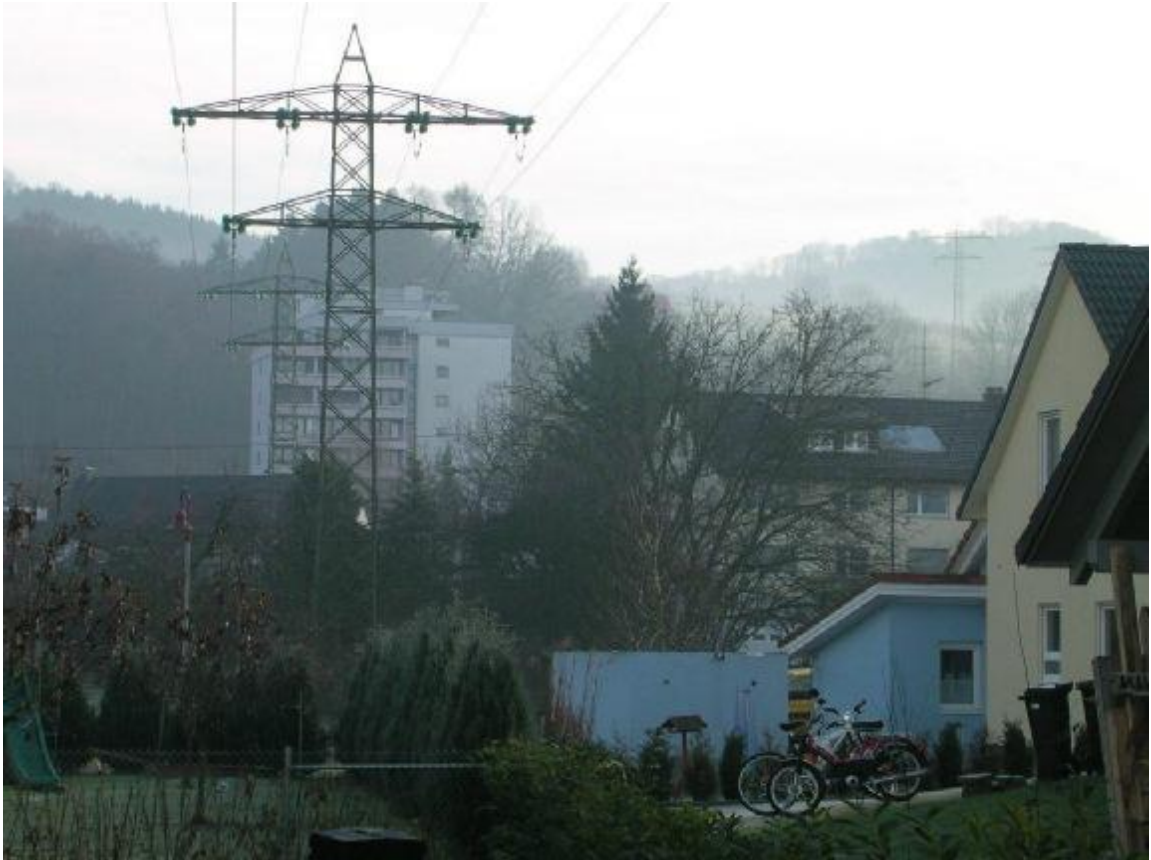
Freileitung des Kraftwerks Reckingen