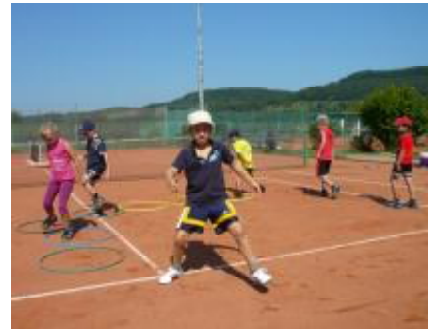
Tennis-Schnuppertraining bei der FEZ (Ferien zu Hause) am 8. September 2009

An dieser Stelle möchten wir allen Mitwirkenden an den genannten Veranstaltungen herzlich danken und hoffen auf eine weitere gute Zusammenarbeit im Jahr 2010.