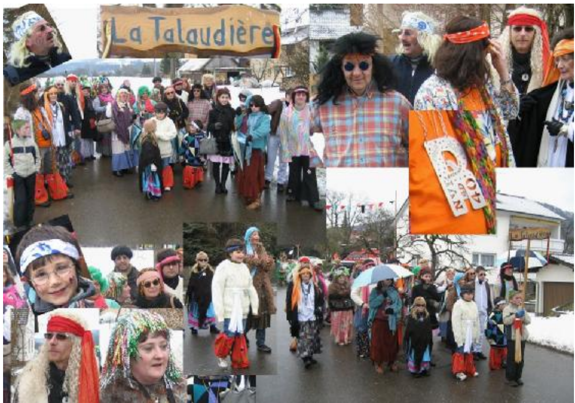
Eine Gruppe aus La Talaudière bereicherte den Umzug am Küssaburger Narrentreffen im Februar 2009