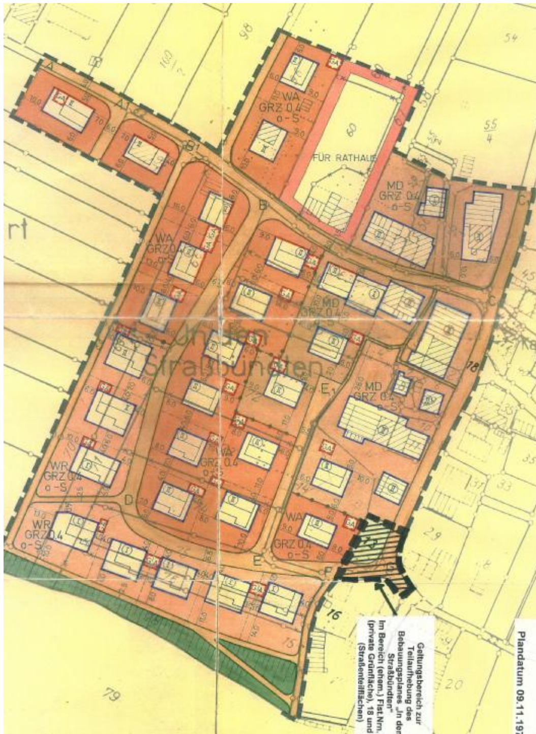
Geltungsbereich der Teilaufhebung des Bebauungsplanes „In den Straßbündten“, Flst.Nrn. 18 und 816 (Teil) sowie Flst.Nr. 827