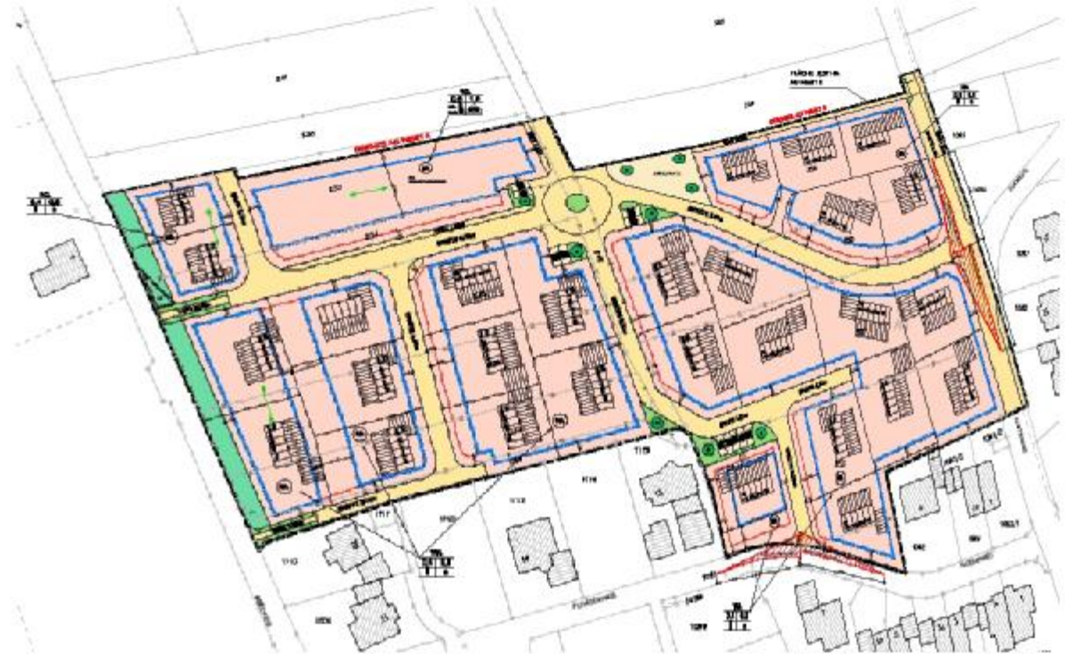
Geltungsbereich des Bebauungsplanes „Au West II“