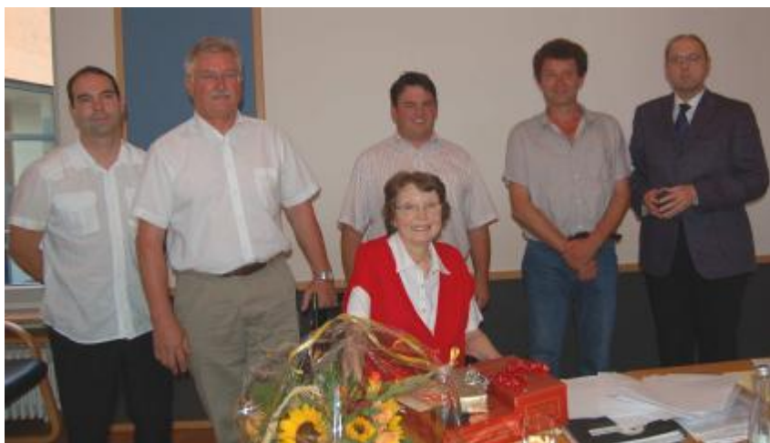
Aus dem Gremium ausgeschiedene Gemeinderäte