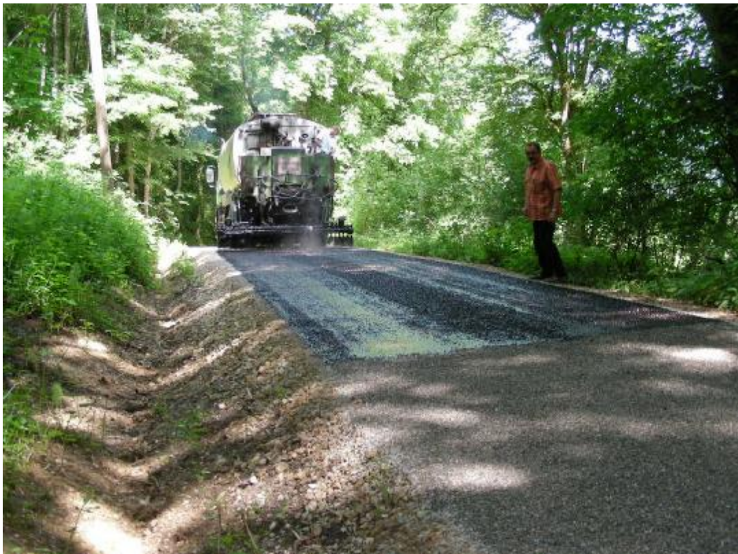
Die Schadstellen im Feldwegbereich können nur schrittweise und abgestimmt auf die finanzielle Situation der Gemeinde ausgebessert werden; auf dem Bild der Einsatz zwischen Hauackerhof und Rohrhof im Frühjahr 2009

Auch im Jahr 2010 werden drei Schadstellen im Feldwegbereich ausgebessert. Der Gemeinderat entschied sich in einer zurückliegenden Sitzung für Sanierungsarbeiten auf den Gemarkungen Bechtersbohl, Küßnach und Kadelburg mit einem voraussichtlichen Gesamtaufwand von rd. 20.000 €