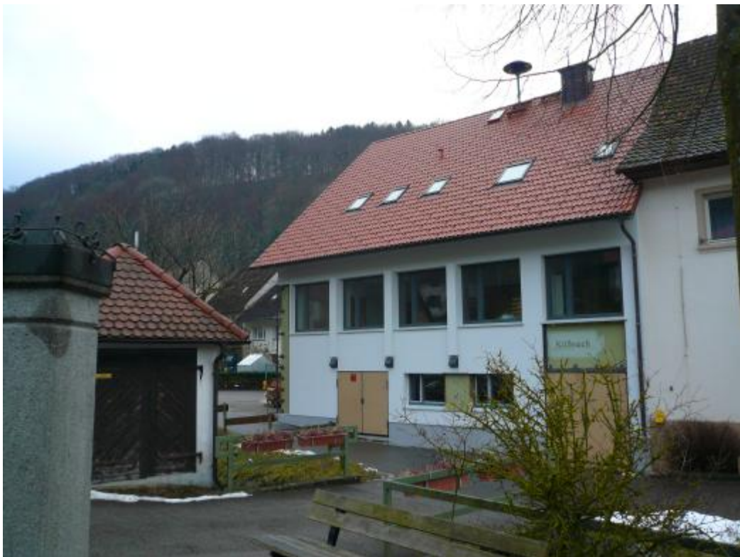
Das neu sanierte Bürgerhaus; die bisherigen Energieverluste konnten deutlich reduziert werden

Der vom Gremium beauftragte Architekt konnte die Ergebnisse der Voruntersuchungen und die Planungsvorschläge bereits anlässlich der öffentlichen Sitzung vom 18.05.2009 vorstellen. Der Gemeinderat billigte die Konzeption und erteilte in den Sommermonaten die notwendigen Aufträge u. a. zum Austausch der Fenster und zur Aufbringung des Vollwärmeschutzes. Gleichzeitig wurden die veralteten Tür- und Toranlagen im Untergeschoss des Gebäudes ausgetauscht. Die Restarbeiten sollen bei entsprechender Witterung im Frühjahr 2010 ausgeführt werden. Für die Verbesserungen werden Kosten von rd. 110.000 € erwartet. Der Zuschuss des Bundes ist mit 56.000 € veranschlagt.