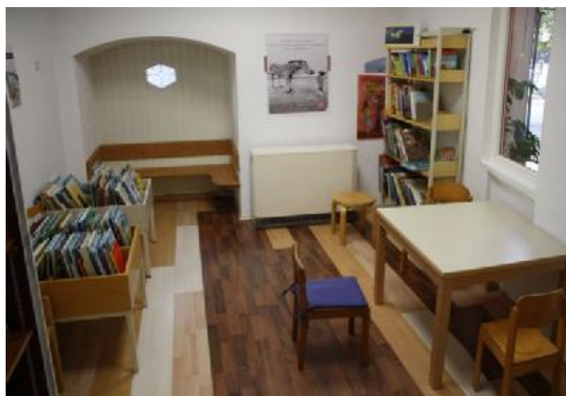
Die Räumlichkeiten der Bücherei Rheinheim