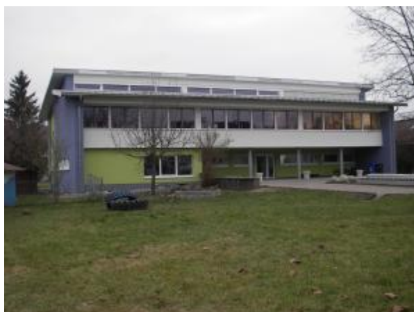
Mit Gesamtkosten von rd. 275.000 € wurde im Jahr 2009 das Kindergartengebäude im Ortsteil Rheinheim saniert

Auch der von Verwaltung und Kindergartenleitung vorgeschlagene Ausbau der Kellerräume im Kindergarten Kadelburg wurde vom Regierungspräsidium als förderwürdig anerkannt. Die dortigen Räume sollen künftig dem Kindergarten für zusätzliche Beschäftigungsangebote zur Verfügung stehen. Die Gesamtkosten werden sich auf rd. 40.000 € belaufen, wobei der anteilige Zuschuss hier rd. 20.000 € beträgt.