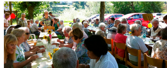
Kaffee und Kuchen beim Bädle-Treff